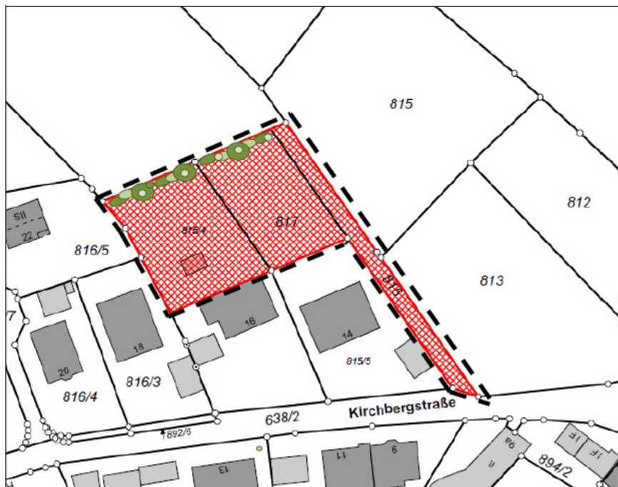
Lageplan erstellt Sommer 2017 (© Bayer, Vermessungsverwaltung 2018)

Die Bauverwaltung sieht keine Belange des Marktes Diethofen durch den Erlass der Ortsab- rundungssatzung „Kirchbergstraße“ der Gemeinde Großhabersdorf für den Ortsteil Vincenzen- bronn berührt.