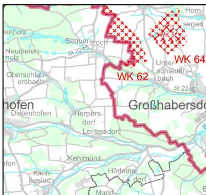
rechtsverbindlicher Stand im Regionalplan

Stadt/Gemeinde: Diethenhofen (Lkr. Ansbach)