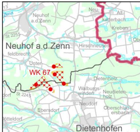
rechtsverbindlicher Stand im Regionalplan

Stadt/Gemeinde: Diethenhofen und Neuhof a.d.Zenn (Lkr. Ansbach und Lkr. Neustadt a.d.Aisch-Bad Windsheim)