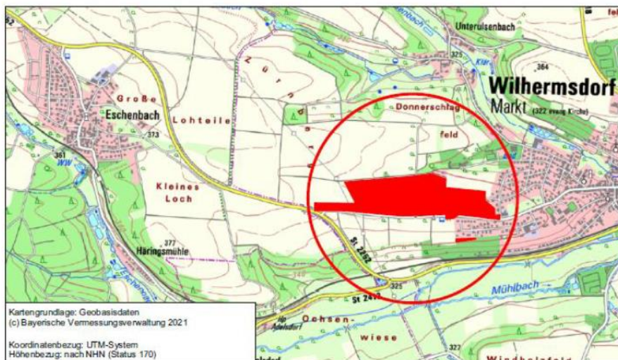
Übersichtslageplan zur Lage der Änderung des Flächennutzungsplans mit integriertem Landschaftsplan im Marktgemeindegebiet, ohne Maßstab

Gemäß § 4 Abs. 2 BauGB werden die Unterlagen im Rahmen der Öffentlichkeits- und Trägerbeteiligung mit der Bitte um Stellungnahme vorgelegt.