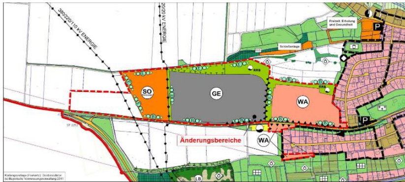
Verkleinerter Auszug aus dem Planblatt zur Änderung des Flächennutzungsplans, ohne Maßstab, © Kartengrundlage Bay. Vermessungsverwaltung 2022, geodaten.bayern.de